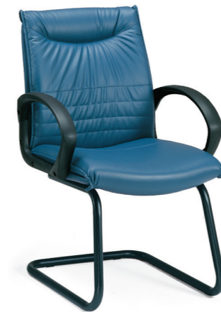
IDEA EXECUTIVE CHAIR