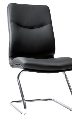
ZETA EXECUTIVE CHAIR